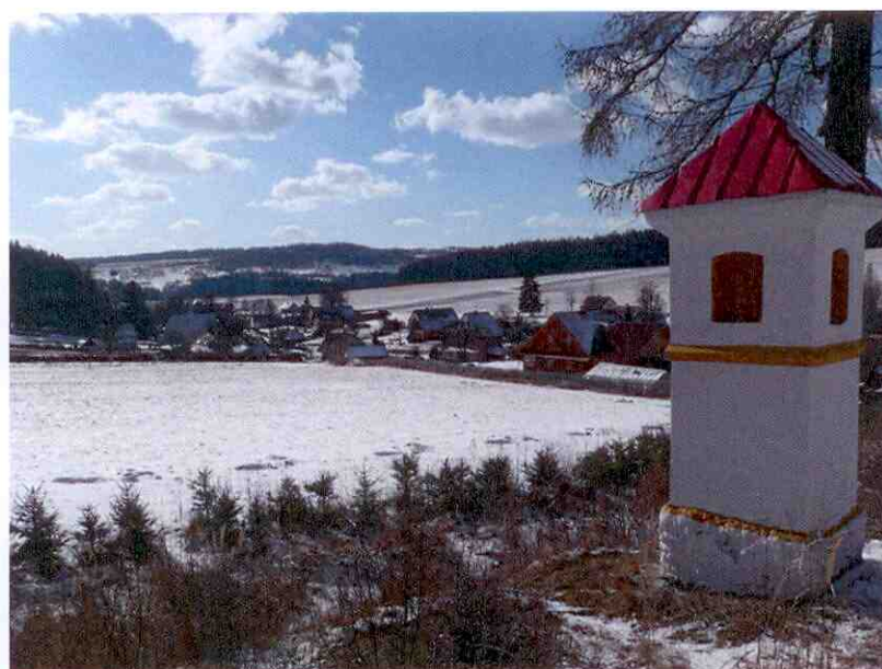
Obrázek č. 2: Pohled na Dlouhou Stráň

Obec Dlouhá Stráň se zapojuje do místních iniciativ. Je partnerem Místní akční skupiny Hrubý Jeseník a taktéž členem Mikroregionu Slezská Harta a sdružení obcí Bruntálska. Nemá žádné partnerské město či obec.